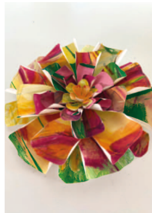
Kreatives zu Frühling und Ostern