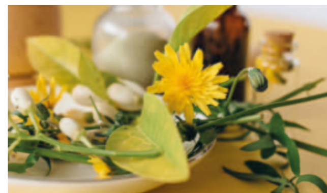
Hildegard von Bingen und ihre Kräuter - siehe ru-im-puls