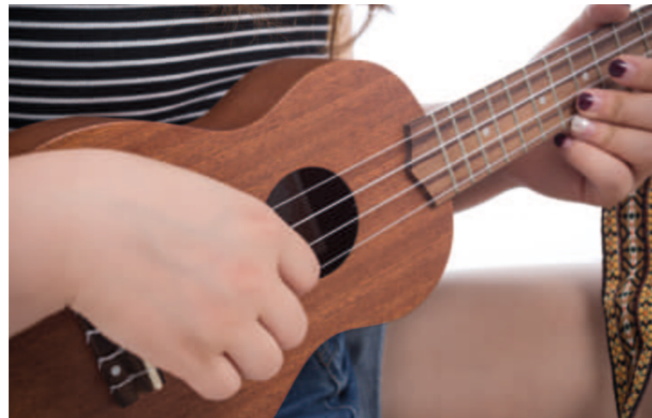
Ukulele für Anfänger siehe ru-im-puls.ch