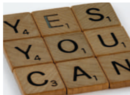
Zeig dich - wirkungsvoll!