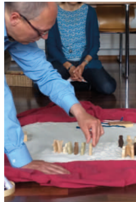
Godly play siehe ru-im-puls.ch