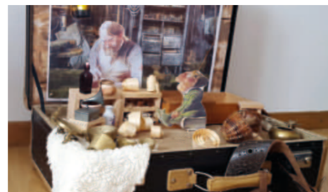
Geschichten aus dem Koffer